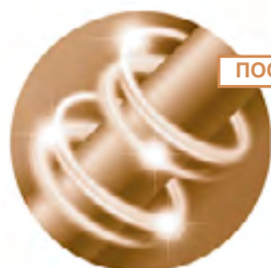
восстановленные гладкие сияющие прочные волосы