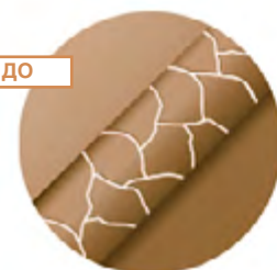
пересушенные поврежденные ломкие тусклые волосы

Поможет устранить ломкость волос, обеспечит им восстановление по всей длине, придаст дополнительный объем и плотность, сделает волосы послушными и блестящими. Гидролизированный кератин, масло камелии, масло ши, биоцерамидный комплекс и уникальная система кондиционеров заполняют поврежденные участки и восстанавливают волосы на молекулярном уровне.