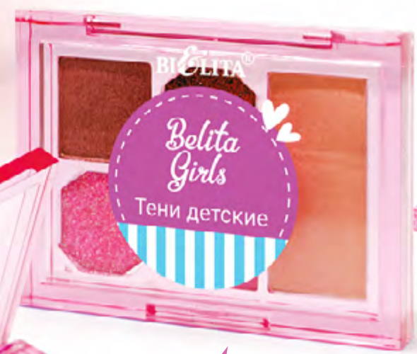
Тени детские GOLDEN STAR

Палетка Sunny Bronze — это яркие оттенки, которые идеальны для летнего настроения и яркого макияжа. Нежная текстура, безопасный состав и легкое нанесение делают эти тени любимыми у юных модниц.