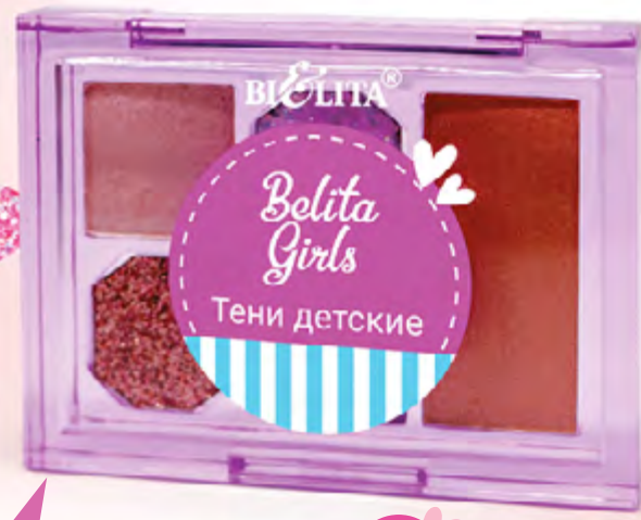
Тени детские SUNNY BRONZE

Тени Silver Moon для тех, кто мечтает о космических приключениях и блестящих образах! 5 модных оттенков, которые подойдут для вечернего образа маленькой звезды. Безопасные и удобные в использовании.