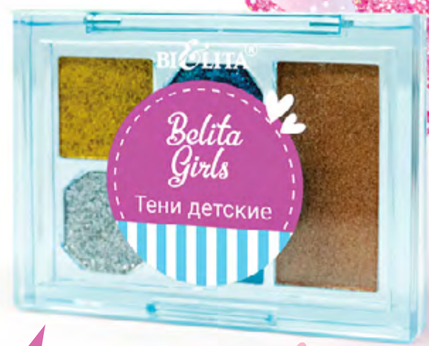
Тени детские SILVER MOON

Линия детской косметики «Belita Girls» создана специально для маленьких принцесс, которые мечтают быть похожими на маму, но при этом нуждаются в бережном и безопасном уходе. Косметические продукты линии разработаны с учетом особенностей детской кожи и не содержат агрессивных компонентов — только легкие, нежные формулы, яркие цвета и волшебные ароматы! Belita Girls — это не просто косметика. Это способ выразить себя, поиграть в красоту и почувствовать себя особенной!