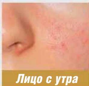
Лицо с утра

ОСОБЫЕ ПИГМЕНТЫ — для деликатного тонирования кожи