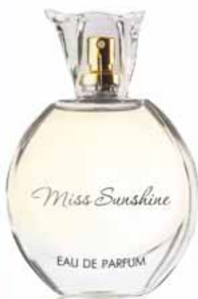
ПАРФЮМЕРНАЯ ВОДА Miss Sunshine аромат создан по мотивам Chanel Coco Mademoiselle

Верхние ноты: апельсин, фрезия, бергамот, персик Ноты сердца: жасмин, роза Шлейфовые ноты: мускус, ветивер, ваниль, пачули