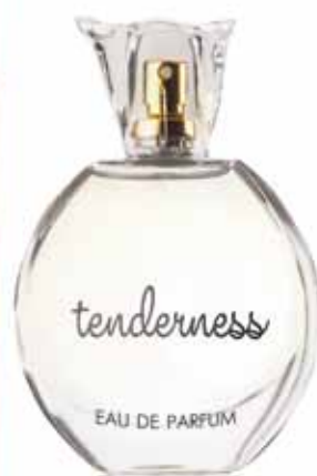
ПАРФЮМЕРНАЯ ВОДА Tenderness аромат создан по мотивам VERSACE Bright Crystal

Верхние ноты: грейпфрут, смородина Ноты сердца: фрезия, роза, фиалка Шлейфовые ноты: мускус, сандал, кедр, малина