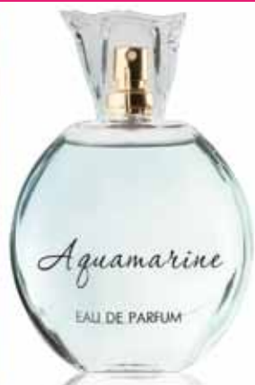
ПАРФЮМЕРНАЯ ВОДА Aquamarine аромат создан по мотивам Giorgio Armani Aqua di Gio Femme

Верхние ноты: лимон, фиалка. Ноты сердца: жасмин, роза, Иланг-Иланг Шлейфовые ноты: сандал, мускус