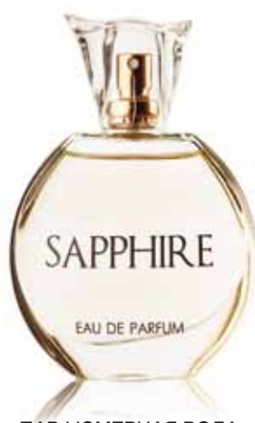
ПАРФЮМЕРНАЯ ВОДА Sapphire аромат создан по мотивам Dolce & Gabbana 3 L'Imperatrice

Верхние ноты: ананас, ревень, яблоко Ноты сердца: жасмин, ландыш, фрезия Шлейфовые ноты: мускус, персик, ваниль