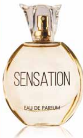
ПАРФЮМЕРНАЯ ВОДА Sensation аромат создан по мотивам J'adore Dior

Верхние ноты: яблоко, фиалка Ноты сердца: роза, иланг-иланг, гардения Шлейфовые ноты: мускус, сандал