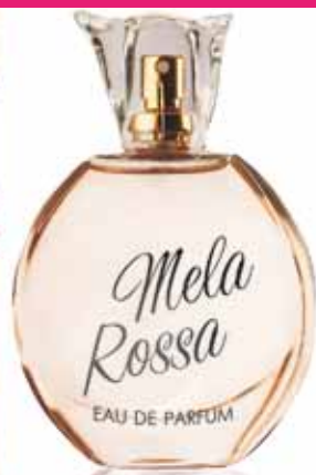
ПАРФЮМЕРНАЯ ВОДА Mela Rossa аромат создан по мотивам Nina Ricci Nina

Верхние ноты: лимон, апельсин, малина Ноты сердца: ландыш, роза, кедр Шлейфовые ноты: мускус, ваниль