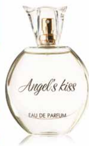
ПАРФЮМЕРНАЯ ВОДА Angel's kiss аромат создан по мотивам Givenchy Ange ou Demon le Secre

Верхние ноты: груша, бергамот, апельсин Ноты сердца: жасмин, гвоздика, водяные лилии Шлейфовые ноты: пачули, кедр, мускус, малина