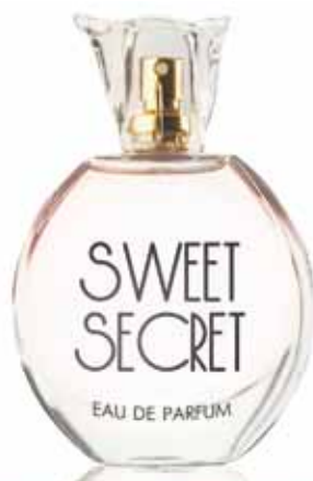
ПАРФЮМЕРНАЯ ВОДА Sweet secret аромат создан по мотивам Chanel Chance Eau Tendre

Верхние ноты: лимон, зеленое яблоко Ноты сердца: гиацинт и жасмин, магнолия Шлейфовые ноты: амбра, кедр, мускус