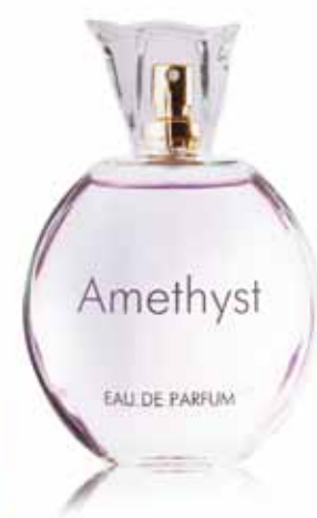
ПАРФЮМЕРНАЯ ВОДА Amethyst аромат создан по мотивам Eclat d Arpege от Lanvin

Верхние ноты: лимон, яблоня, фиалка Ноты сердца: пион, фрезия Шлейфовые ноты: кедр, мускус, сандал