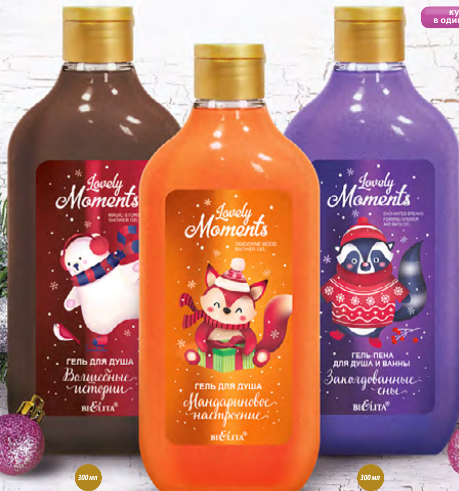
4 Мир косМетуки