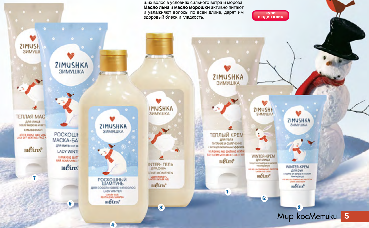
Мир косМетуки 5